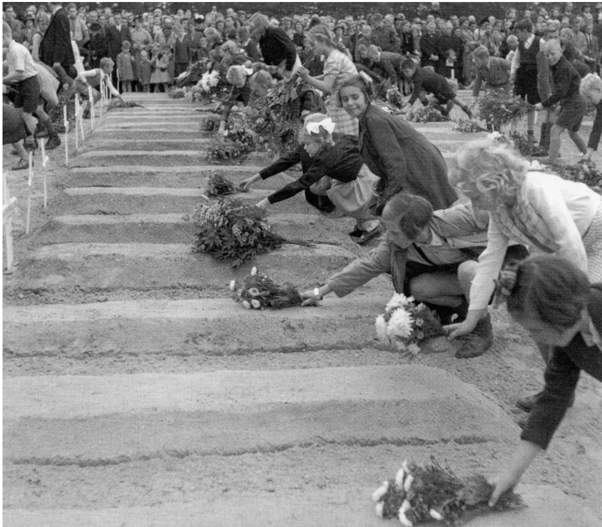
Foto van de 1 e bloemlegging in september 1945