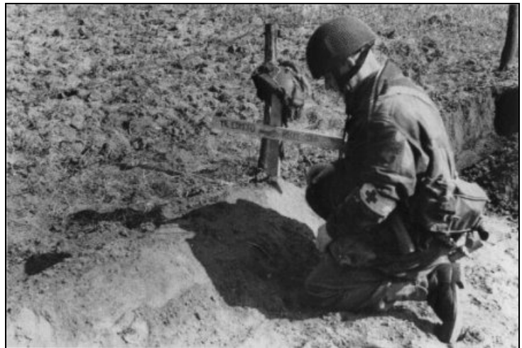
Op deze foto ligt soldaat William Mckinlay Edmond nog in zijn veldgraf begraven, ergens bij een weiland in Oosterbeek. Na de oorlog werden de veldgraven geopend en de lichamen werden op de Airborne begraafplaats opnieuw begraven. William was 27 jaar en is op de eerste dag van de slag, op 17 september 1944, al gesneuveld. Hij ligt op rij 16.B.09.