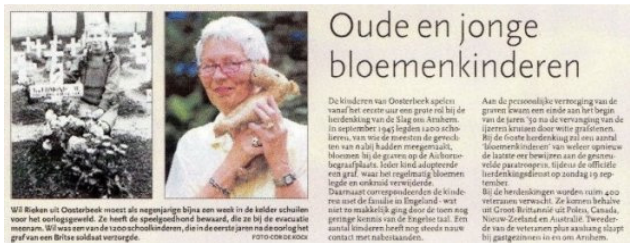
Dit artikel stond op zaterdag 11 september 2004 in het Algemeen Dagblad.