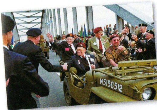
Veteranen in 2004 bij Arnhem. Als helden worden de oud-strijders nog elk jaar ontvangen.

Ook de Slag om Arnhem wordt nog ieder jaar herdacht. Geallieerde soldaten die toen meegedaan hebben, komen dan naar Arnhem, waar ze hartelijk ontvangen worden. Ook al is de slag destijds mislukt!