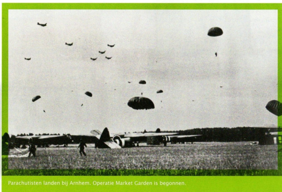
Parachutisten landen bij Arnhem. Operatie Market Garden is begonnen.

Op 17 september 1944 begint de aanval van Amerikaanse, Engelse en Poolse soldaten. Ze worden bij Nijmegen en Arnhem uit vliegtuigen 'gedropt'. Duizenden parachutisten landen. Na felle gevechten veroveren ze de bruggen over de Maas en de Waal. Dan steken ze de Rijn over en krijgen de Rijnbrug in handen. Maar het Duitse leger is sterker. De Rijnbrug moet na enige dagen weer worden afgestaan aan de vijand. De geallieerden hebben de slag om Arnhem verloren. De oorlog zal nog zeker een halfjaar duren!