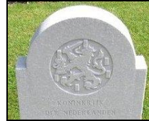
KONINKRIJK DER NEDERLANDEN